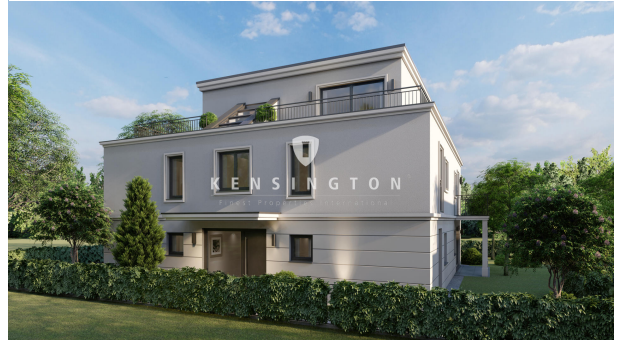
Außenansicht mit Blick auf den Eingangsbereich