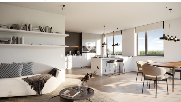
Wohnung Nr. 8