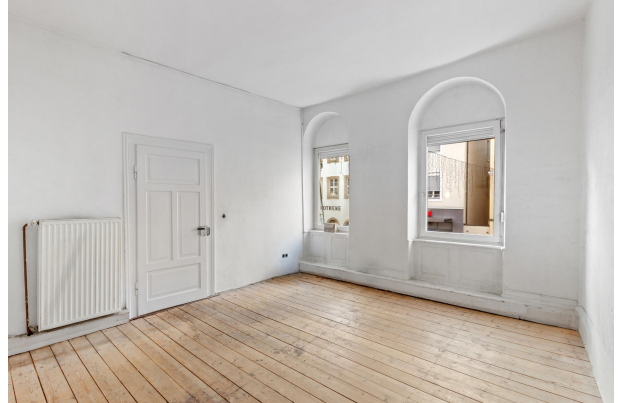
Lager / Küche