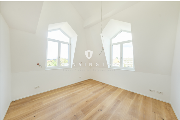
helles Schlafzimmer mit hohen Decken