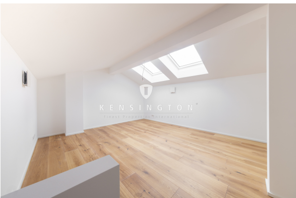
Galerie mit viel Licht