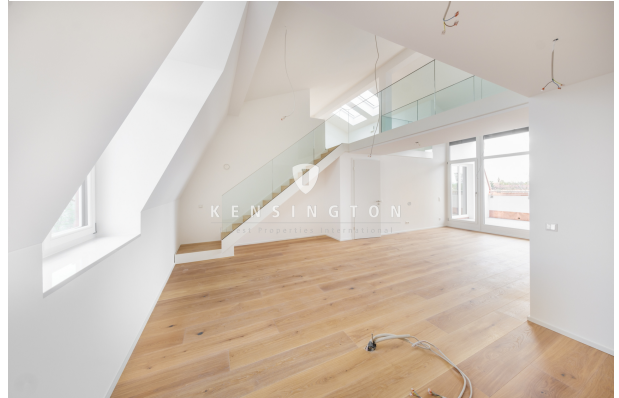
Wohn- und Esszimmer mit Blick auf die Galerie