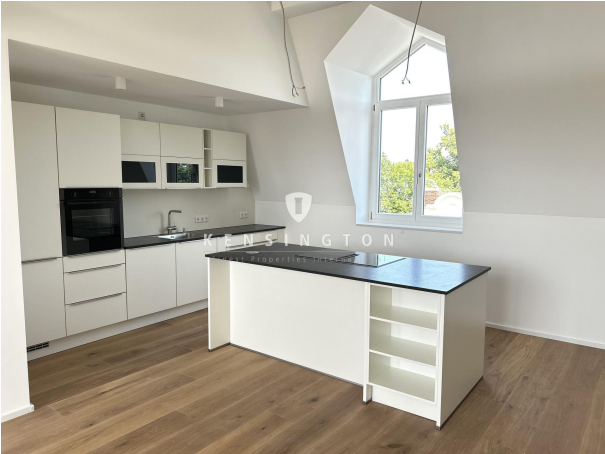
Ihre neue Küche