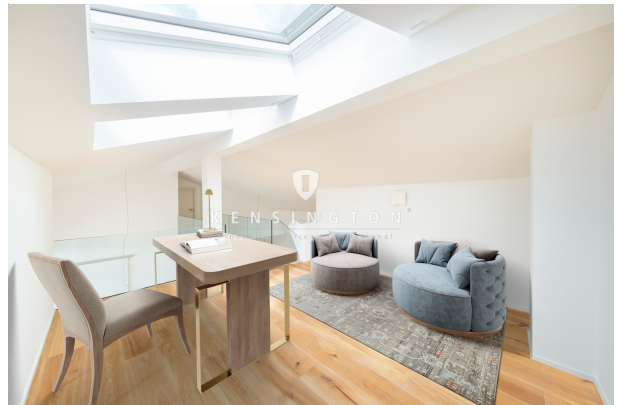
schönes Büro unter dem Dach