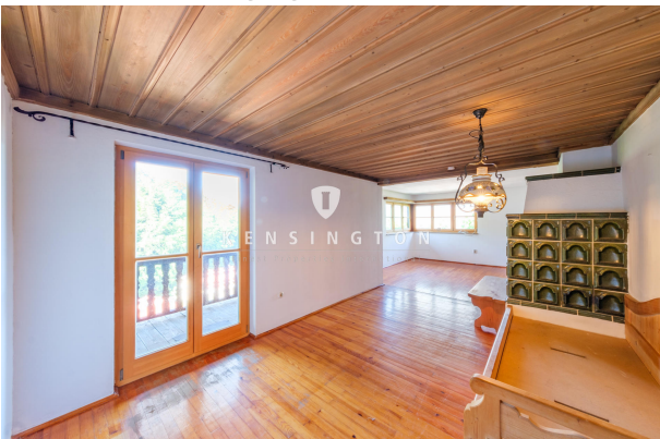
Wohnbereich mit Zugang Balkon