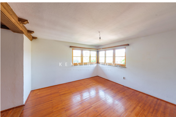
Wohnbereich mit Seeblick