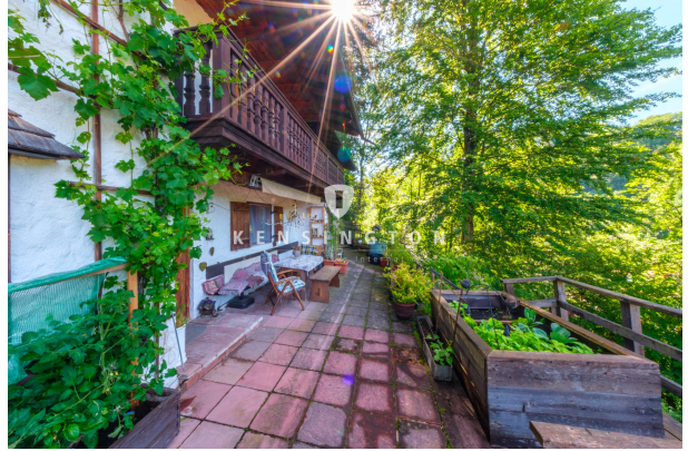
Terrasse Blickrichtung Osten