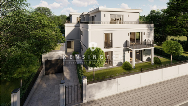
Außenansicht von der Straßenseite