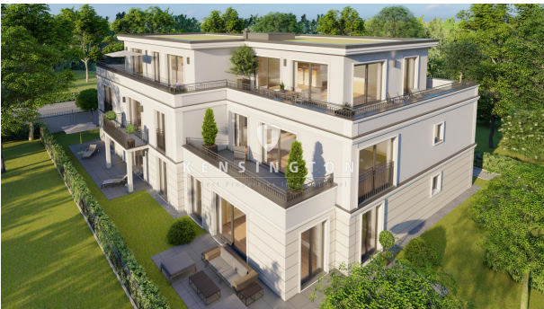
Außenansicht mit Blick auf das elegante Projekt