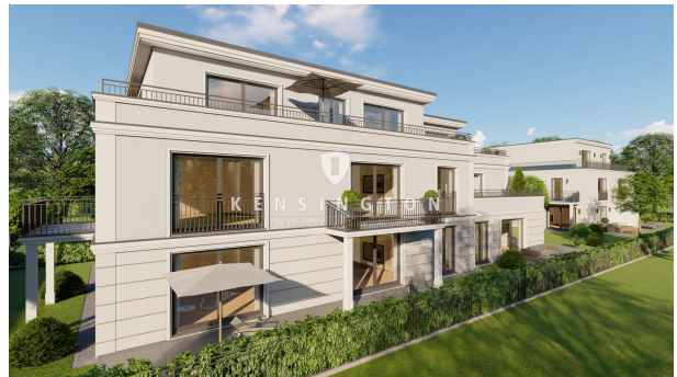
Außenansicht mit Gartenblick