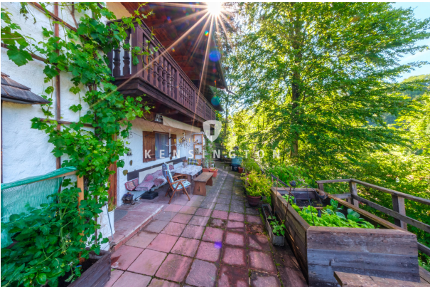
Terrasse Blickrichtung Osten