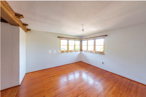
Wohnbereich mit Seeblick