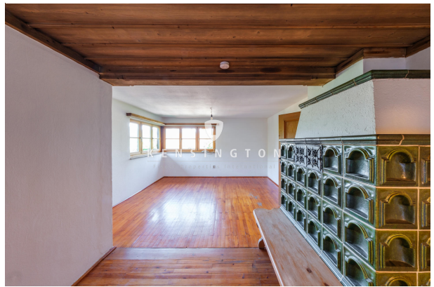
Wohn/Essbereich mit Kachelofen