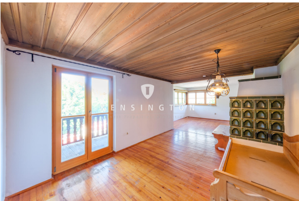
Wohnbereich mit Zugang Balkon