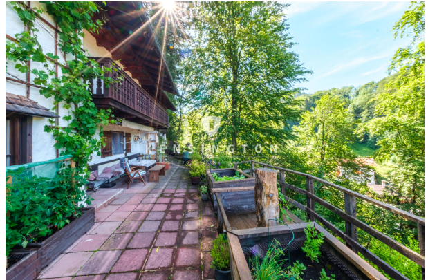
Terrasse mit Blickrichtung zum Berg