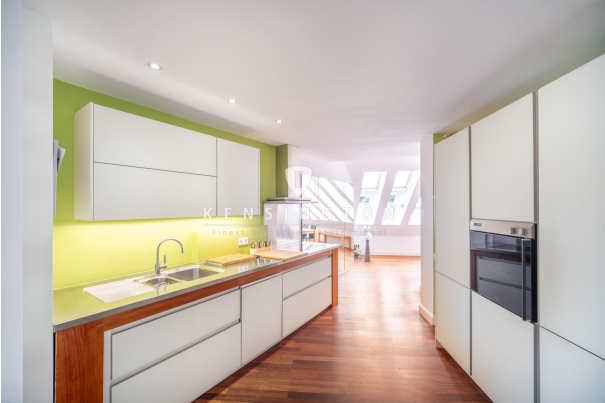
offen Küche mit Zugang zum Esszimmer