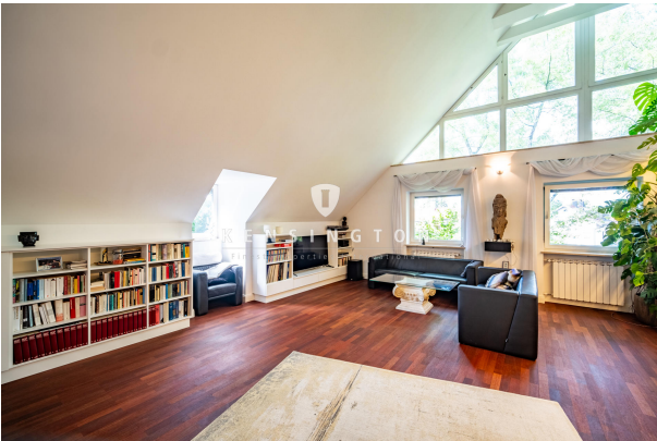
Wohnzimmer mit viel Tageslicht