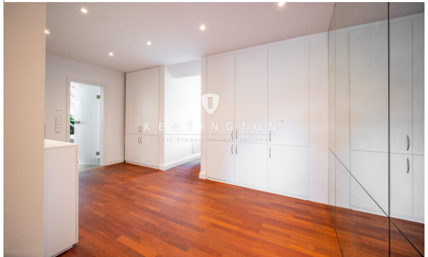
Ankleidezimmer mit Zugang zum Schlafzimmer und Badezimmer