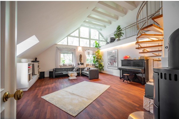
Wohnzimmer mit hohen Decken