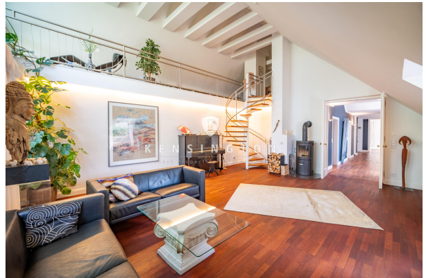
Wohnzimmer mit Blick in die Galerie