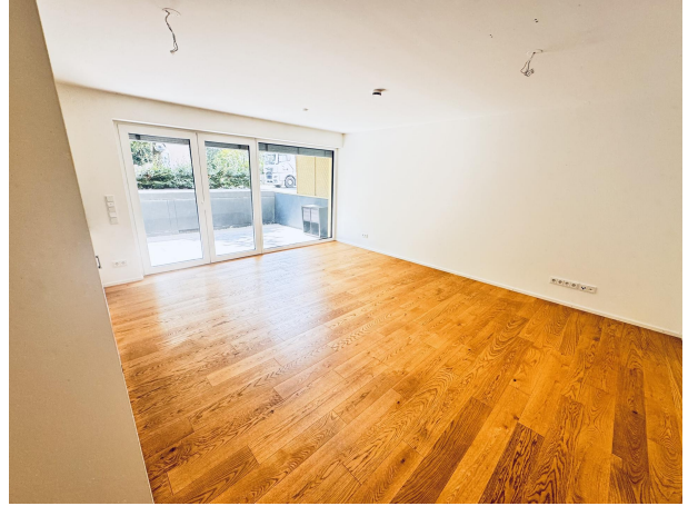
Wohnzimmer mit Zugang zur Terrasse