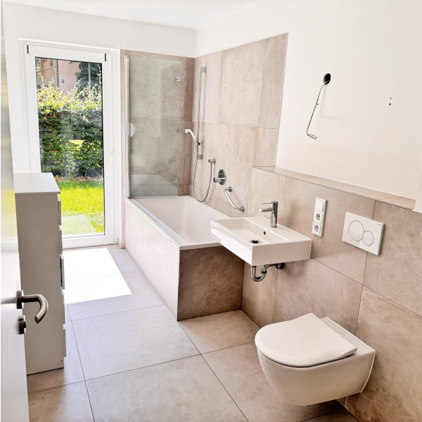
Smart Home Steuerung