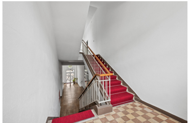
Flur im 1. OG