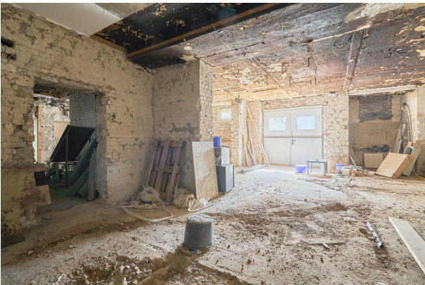
Bis zu ca. 3m Deckenhöhe