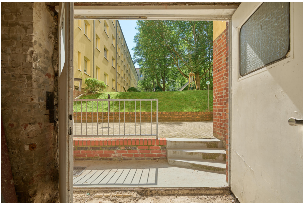
Unverbautes Souterrain gewährleistet viel Helligkeit