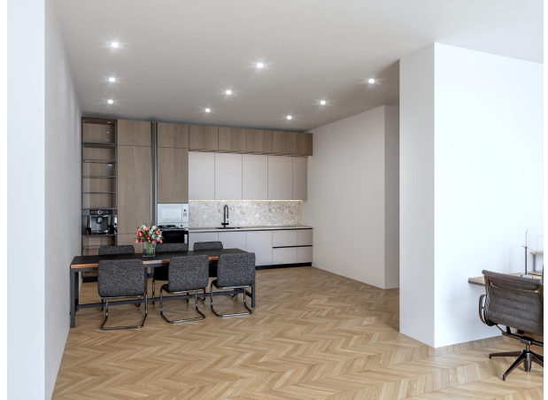
Möglicher Büroumbau, bereits genehmigt