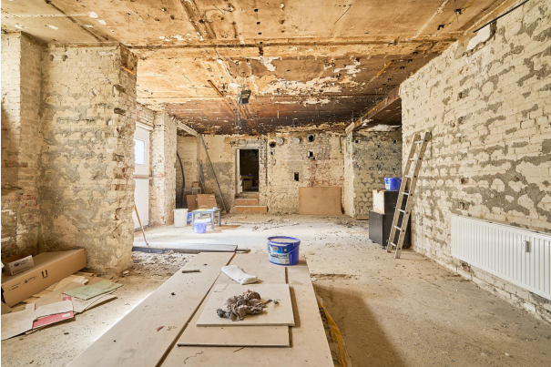
Ca. 160m 2 Souterrain mit Baugenehmigung